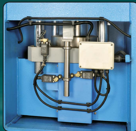
Premilamiera, Serre-tôle, Blank-holder, Blechhalter, Cojín